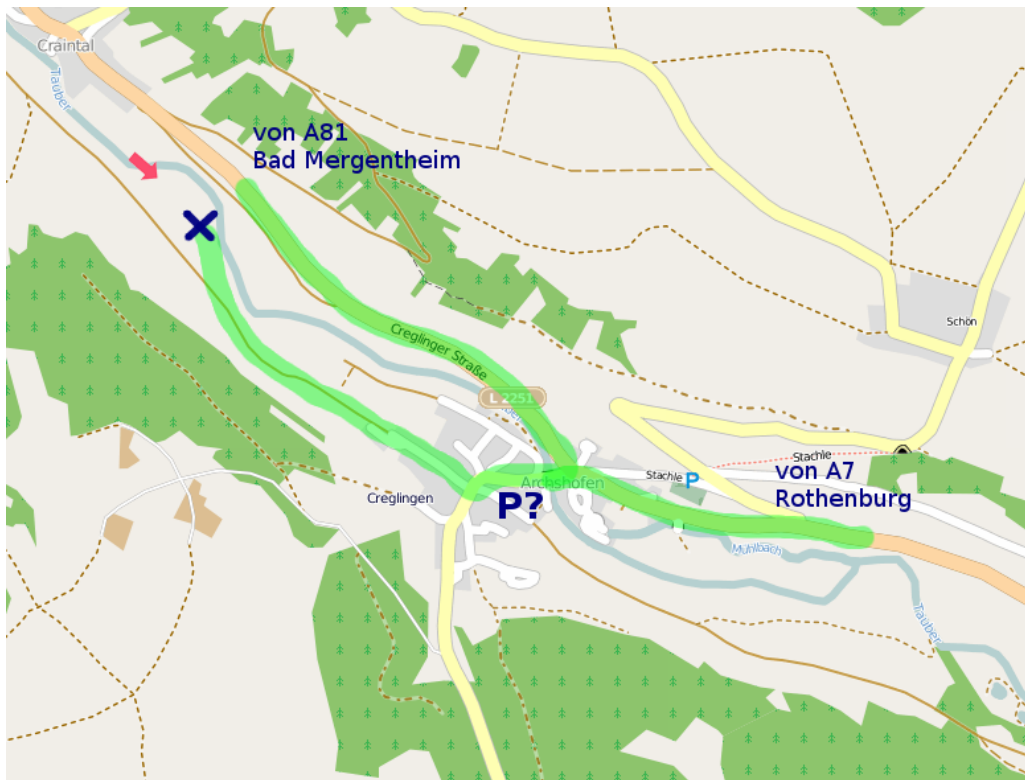
Karte: © OpenStreetMap und Mitwirkende, CC BY-SA

Im Ort links über die Tauber und der Beschilderung folgen.